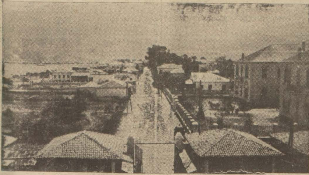
İskenderunda Hastane caddesi

Yüz kızartacak şiddet ve suiistimalleri bitaraflığına itimat edeceğiniz tahkik heyetleriyle isbat edeceğiz. İntihap sandıklarına sahte puslalar atıldı