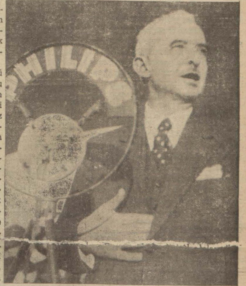
Başvekil nutuk söylerken