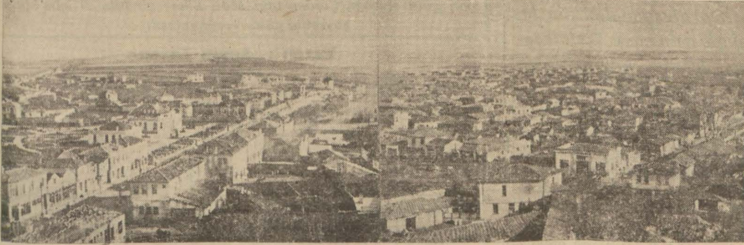
Lüleburgazın umumî görünüşü

Lüleburgazda bilhassa göçmen işlerine ehemmiyet veriliyor, şimdiye kadar 2057 hanede beş bin göçmen yerleştirildi