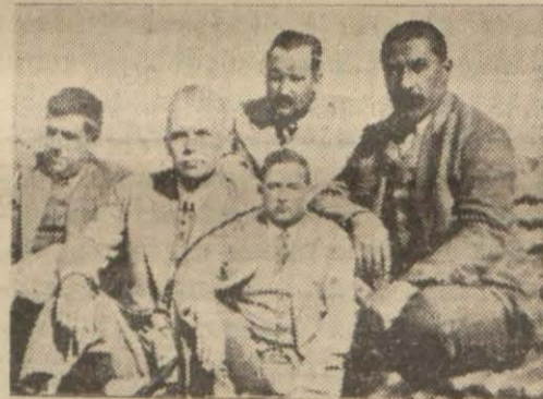
Arapkir hükümet erkânı vilâyet konağının damında

Arapkir hükümeti konağı genişletildi, bütün daireler bir araya toplandı